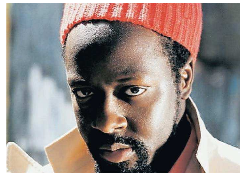
Wyclef Jean steuert einen der Album-Hits bei.

◆ POTATOTäglich verlost jeweils drei Exemplare der Doppel-CDs „Let's Dance Vol. 2“ und „Fetenkult – Strandparty 2007“. Sendet bis 11. Juni eine SMS mit dem Stichwort POTATO CDs, Eurem Namen und Eurer Adresse an 82444 (50 Cent/SMS).