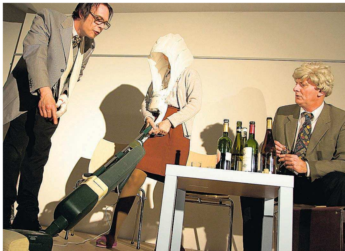
Der Heinzmann saugt auf der Bühne der neuen Eventhalle.

Donnerstag, 8. Mai: Die Berlin Comedian Harmonists in Concert. „Best of“-Programm.